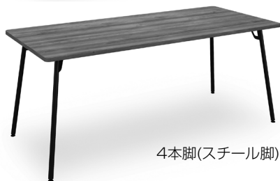
4本脚(スチール脚)タイプ